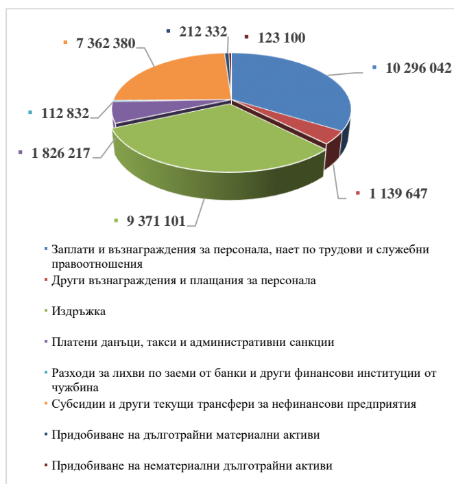
Фигура 2: Отчетените разходи на МИИ-ЦУ към 31.12.2023 г. (в лв.)

Източник: ОКИБ на МИИ-ЦУ към 31.12.2023 г.