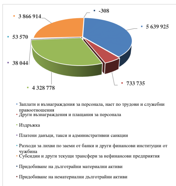
Фигура 3: Отчетените разходи на МИИ-ЦУ към 30.06.2024 г. (в лв.)

Източник: ОКИБ на МИИ-ЦУ към 30.06.2024 г.