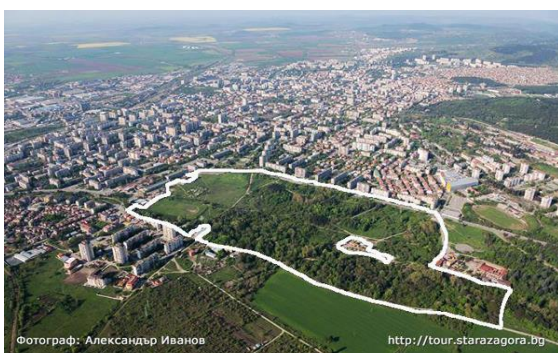
гр. Стара Загора