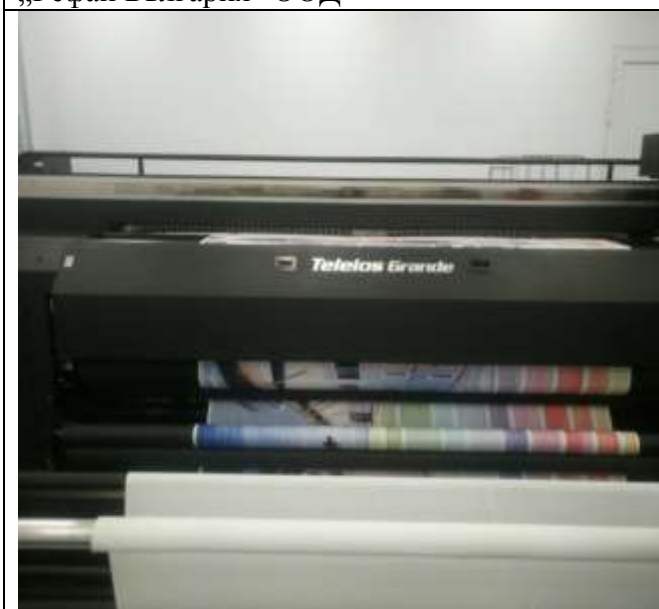
„ПИ ЕН ДЖИ 1962“ ЕООД