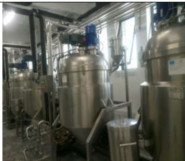
„Александра и Мадлен“ ООД