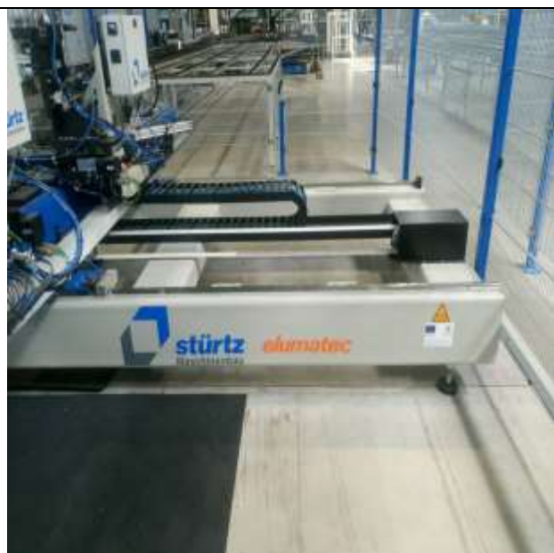
„Ти Ес Би Груп“ ЕООД