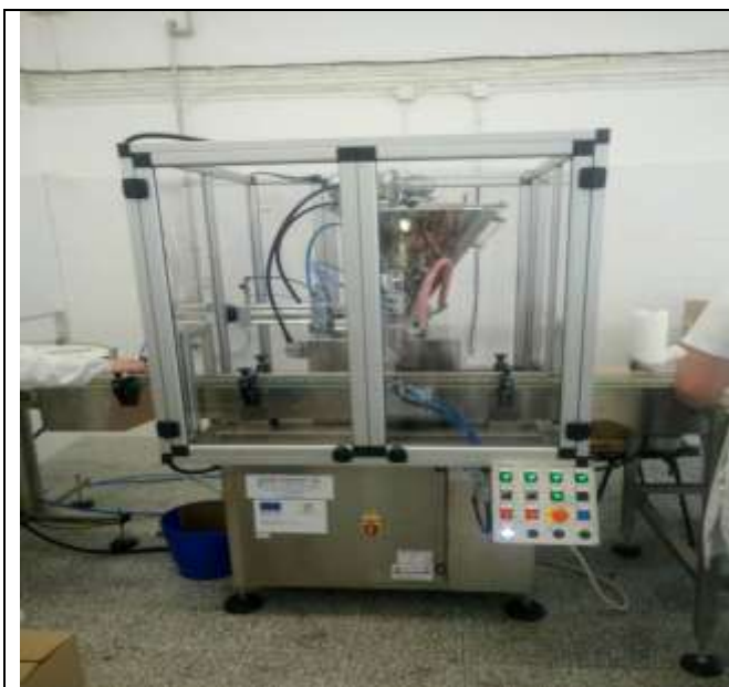
„Рефан България“ ООД