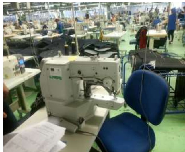
„Туна Деним“ ЕООД